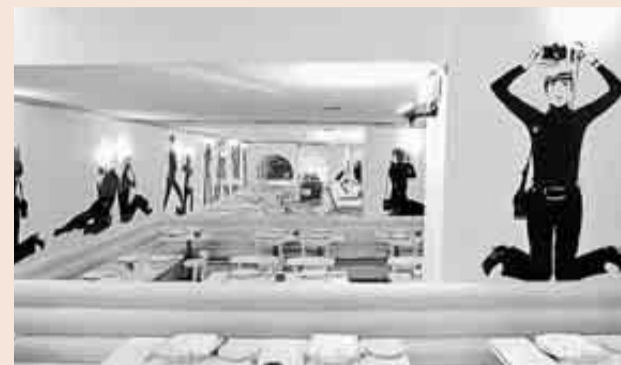
El Flash Flash mantiene la estética de los años sesenta.